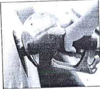
Polttoaineiden hinnat ovat laskeneet hieman.

ÄÄ toaineiden lievä jatkuu. Normaalina polttoaineet. et-sivuston muenssiini maksaa eskimäärin 1,636 dieselin hinta on